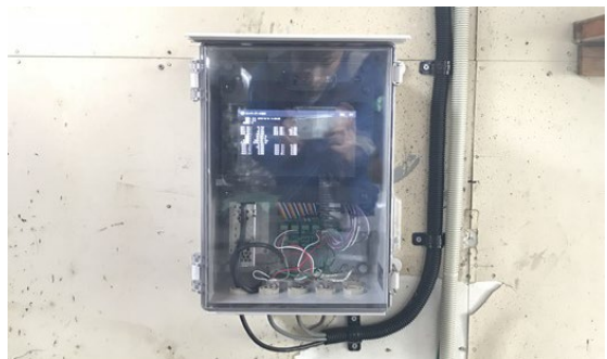
例 6 : データ収録・伝送装置