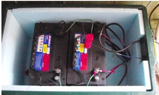
例 3 : バッテリー電源による計測