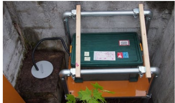
例 4 : 井戸に応じたレイアウトで計測 (実際には屋根を設置)