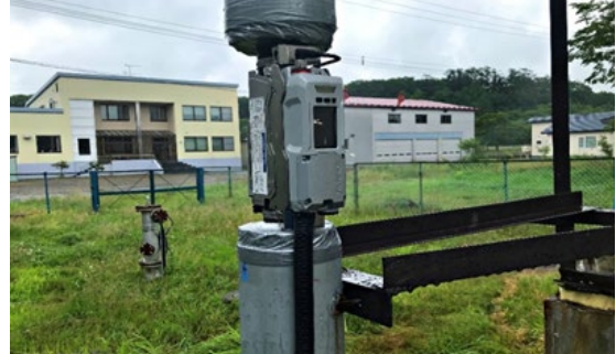
例 2 : 配管を切断せずに流量計を設置 (断熱材のみカット)