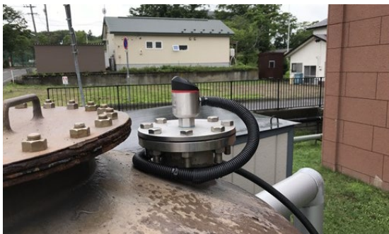
例 5 : 貯湯タンクに設置したレベル計