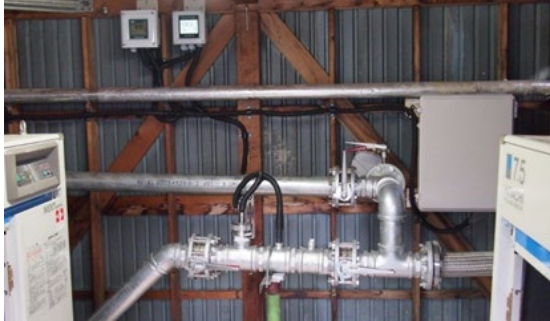
例 1 : バイパス管を製作して各種センサを設置